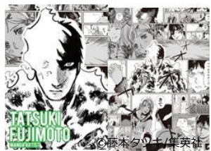
漫画家 藤本 タツキ