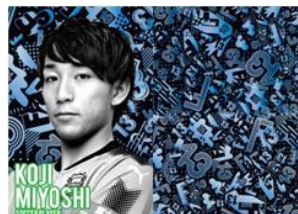
プロサッカー選手 三好 康児