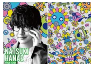
声優 花江 夏樹