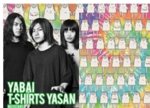
3人組自称メロコアバンド ヤバイTシャツ屋さん