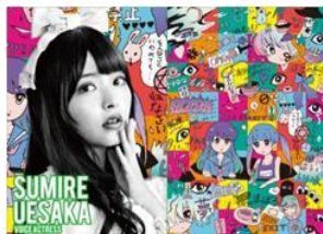
声優 上坂 すみれ