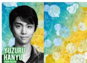
フィギュアスケーター 羽生 結弦

未来への原動力「夢を持つ事」や、好きな楽曲「ジュピター」より、キラキラ輝くデザインにしました。好きなハートやスターの要素に、ピンク色を合わせて、自分らしく表現しました。