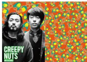
ヒップホップユニット Creepy Nuts (R-指定 & DJ松永)