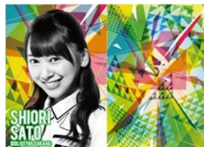
アイドル (榉坂46) 佐藤 詩織