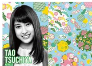
女優 土屋 太鳳