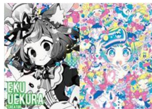
イラストレーター 上倉 エク