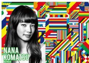
女優・モデル 小松 菜奈