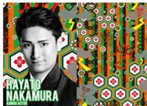
歌舞伎俳優 中村 隼人