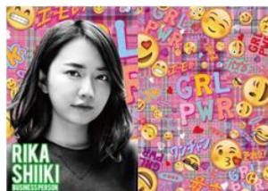
実業家 椎木 里佳