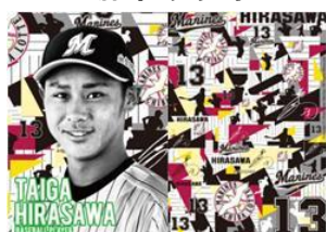
プロ野球選手 平沢 大河