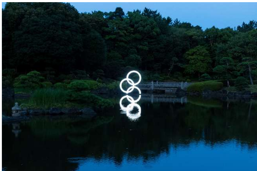
Ripples (2021) Artwork by Shōei Matsuda, Photo by Hidemasa Miyake

近年の主な展覧会に、「The Big Flat Now」(Dubai Festival City、ドバイ)、「コレクション展 1 それは知っている:形が精神になるとき」(金沢 21 世紀美術館、石川) など。2016 年「アルス・エレクトロニカ賞」準グランプリ受賞。