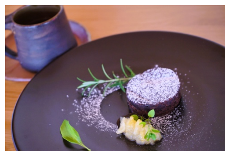
蒸し焼きショコラ ACAO FOREST の檸檬マーマレード

クセのない伊豆の猪を、マレーリバーソルトと黒胡椒のローストでお召し上がりいただけます。猪に見つかる根こそぎ食べられてしまうという甘味の強い人参、県内産本山葵を合わせてお召し上がりいただけます。