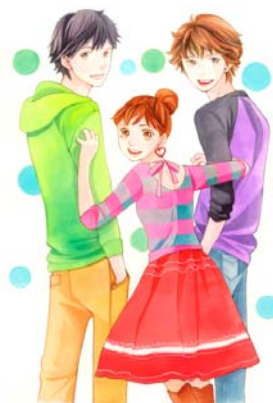
『虎と狼』(C)神尾葉子/集英社

集英社「マーガレット」「別冊マーガレット」50周年特別企画として、神尾葉子作『虎と狼』および河原和音作『高校デビュー』の2作品を配信します。『虎と狼』は、大ヒット作『花より男子』の作者神尾葉子の人気作で、イケメン2人と平凡な女子高生の学園ライフを描いた作品です。『高校デビュー』は、モテたい女子高生とモテコーチとなる男子が登場するラブコメディで、実写映画化もされた話題作です。