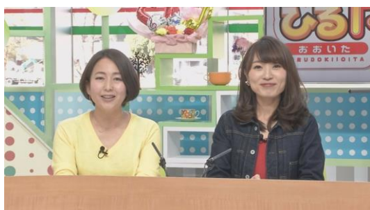
ひるドキッ！おおいた内でご紹介