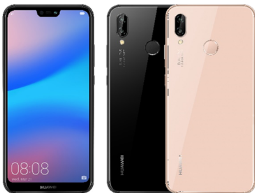
「HUAWEI P20 lite」 (「ミッドナイトブラック」/「サクラピンク」)