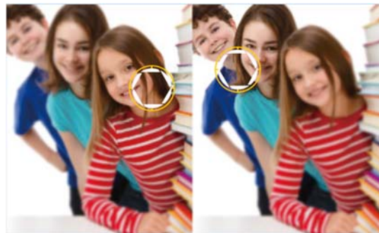
「ワイドパーチャ」機能で 撮影後のフォーカス調整も自由自在