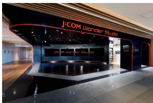
<J:COM Wonder Studio>