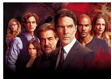
<『クリミナル・マインド シーズン10』> 毎週月曜 22:00 ほか

かつては、レンタル（ビデオ、DVD）で楽しむのが主流だった「海外ドラマ」も、今ではテレビ、パソコン、スマートフォンなど、あらゆる端末で視聴できるようになり、 タイムラグがなく、海外の最新コンテンツを楽しめる環境 が整ってきました。ケーブルテレビでも「海外ドラマ」は根強い人気ジャンルで、映画並みの制作費を投じ、アクション、恋愛、ファンタジー、さらには国際問題を扱う社会派ものまで、日本ではなかなか見ることができないストーリー展開に、一度見るとハマってしまう人が続出。また 人気の出た作品はロングシリーズ化するのも定番 で、今回発表した「J:COM TV」2018年5月のランキングでも人気のある作品がシーズンを重ねてもなお、根強い人気があるということがわかります。中でも F2層（35～49歳女性）のランキングにおいて、ベスト10に4作品（シリーズ）ランクインしたのが『クリミナル・マインド』 。FBIのプロファイラーユニットが凶悪犯罪に挑む犯罪捜査ミステリー。本国アメリカでは、シーズン13に突入するなど、大人気。「スーパー！ドラマTV」の編成担当者からは、作品の魅力について「 プロファイルで犯人を追い詰める過程が、分かりやすく映像化されており、キャラクターの思考や感情を理解しやすい。さらに、捜査官たちの個性的なキャラクターも魅力的。単なる捜査の過程を描くだけでなく、捜査官たちの過去や私生活なども描かれており、より身近な存在として感情移入できるところが、人気の秘密だと思います 」とコメントが寄せられました。同チャンネルで『クリミナル・マインド シーズン10』[二か国語版]を、毎週月曜 22:00 絶賛放送中！基本的には、1話完結の犯罪捜査ドラマになっているので、見たことがない方でも十分楽しめます。「海外ドラマ」における『クリミナル・マインド』のように、さまざまなジャンルに“定番”と呼ばれる人気コンテンツがあります。梅雨が本格化して、出かけるのが億劫になるこの時期、ご自宅でさまざまなジャンルの“定番”コンテンツをイッキ見して、新たなお気に入りを見つけてみませんか？