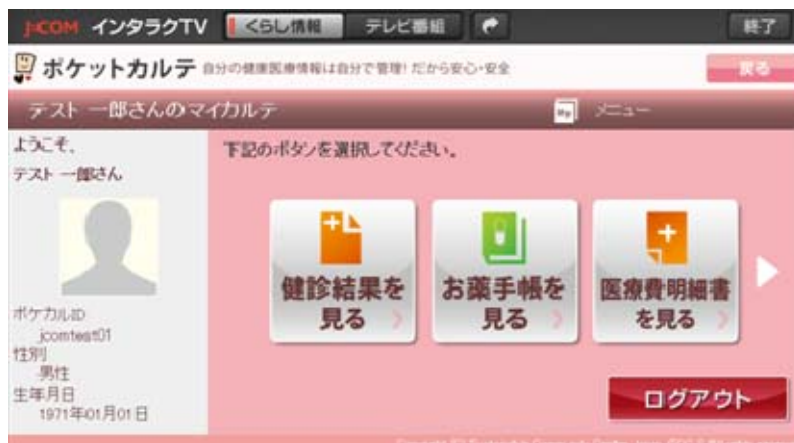
インタラク TV 上のポケットカルテ操作画面

J:COM 京都みやびじょんとSCCJは2014年5月末まで「ポケットカルテ」のトライアル提供に取り組み、サービス提供エリアの拡大や、今後の商用化に向けた検討を実施します。