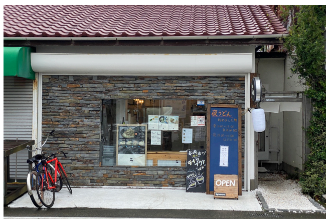
こがね製麺所 湘南店