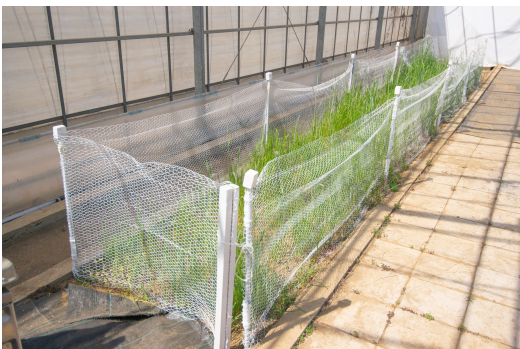
国産生牧草の生い茂ったハウス内のランエリア