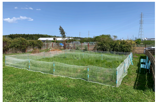
屋外エリアは国産生牧草でいっぱい