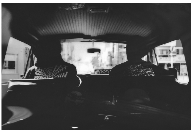
Lifestyle brand 877