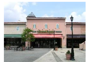
「Sakagami Grand Repas」