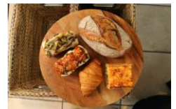
「パンまつり」イメージ