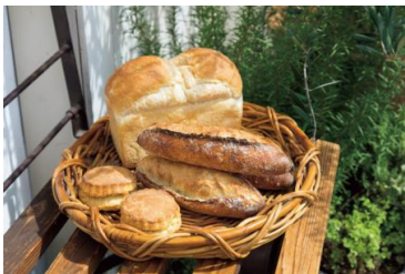
新麦スコーン(写真手前) ¥210

地元の人に愛されている、一軒家のブーランジェリー。パンに合わせて小麦粉や酵母を使い分け、一晚冷蔵熟成させて旨味を引き出している。新麦使用の出品パンは、香りが格別。