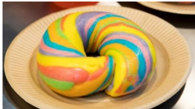
レインボーカラーベーグル ¥378

麻布十番の人気カフェが手掛けるベーグル。もっちり密度のあるNY式のベーグルに、好きなスプレッドと具材を組み合わせできる。積み重なったベーグルの陳列もインスタ映え抜群！！秋の味覚を使ったベーグルも登場予定。