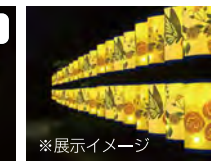
灯り巡り (参加特典あり)