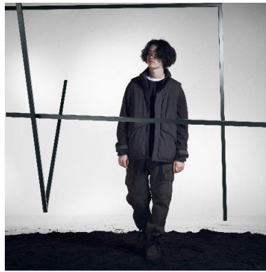
「WILDTHINGS CONCENTRATED STORE」 (11月3日(水・祝)オープン)