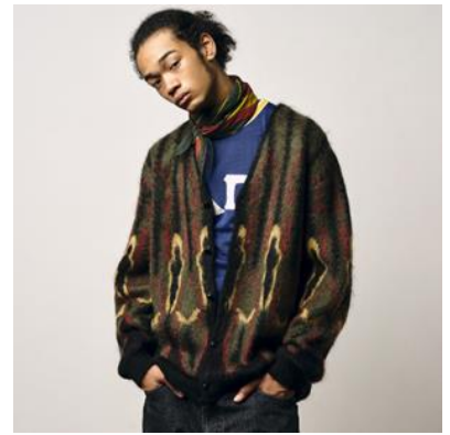
「UNION 30 YEAR POP-UP STORE」 (11月5日(金)オープン)