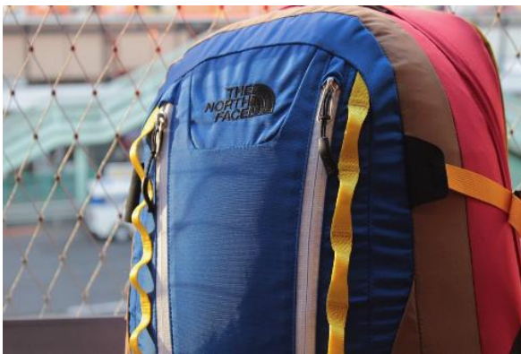
「THE NORTH FACE Backmagic」 (新業態店舗、10月1日(金)オープン)

三井不動産商業マネジメント株式会社（東京都中央区）が運営する『RAYARD MIYASHITA PARK』（東京都渋谷区）は、新業態や期間限定店舗を含むアパレル・飲食の5店舗を新たにオープンし、11月には期間限定のアパレル店舗2店舗を順次オープンいたします。さらに、今年2~3月に期間限定で設置し人気を博した愛媛県宇和島市産の真珠「アコヤ真珠」を使用したパールジュエリーブランド「PEARLS（ペルル）」の製品を非接触で購入できる「真珠販売機」を今夏より常設いたしました。