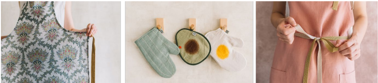
ベティーズオリジナルのリネングッズ

ベティーズならではのプレイフルで温かみあるデザイン展開は、20代から80代までの幅広い層の方にご愛用いただいています。