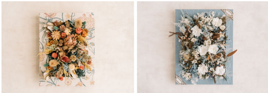
ベティーズのカルトナージュフラワーアレンジメント

ベティーズでは、ヨーロッパで買い付けをした布や紙で一つ一つ制作したカルトナージュの花器に、フラワーアレンジメントを組み合わせ、他にはないオリジナルインテリアとして販売しています。