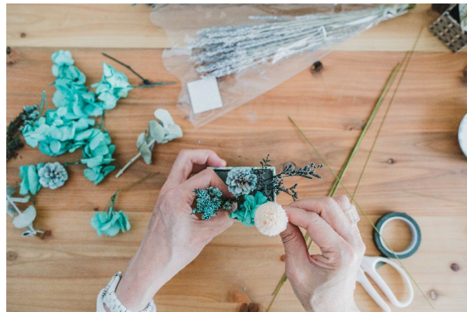
アレンジメント制作風景

同じくフランス発祥の「プリザーブドフラワー」を中心とした花材を使い、ご自身で作った花器にアレンジを施していただきます。ベティーズがセレクトした20種類以上の様々な花材からお選びいただきオリジナルのアレンジメントをお楽しみいただけます。