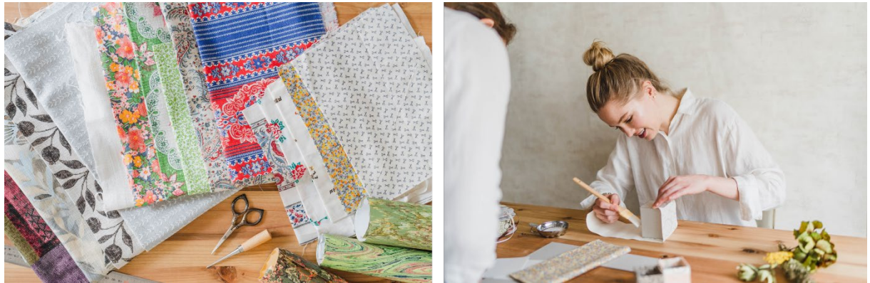
カルトナーージュ体験イメージ

フランスの伝統技法である「カルトナーージュ」体験では、ベティーズがセレクトした10種類以上の布・紙からご自身の好きな素材を選んでいただき、花器を制作いただきます。