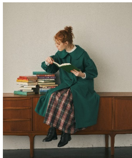
大きな丸襟コート price: 6,500 yen (+tax) color: navy/green/red size: free

正面は一見シンプルなデザインなのに後ろから見るとセーラー襟が大人カワイイコート。さりげないセーラー襟が初めてでも挑戦しやすい1枚。身幅がたっぷりで厚手のトップスでも着ぶくれしにくいサイズ感。お手頃価格なのでお手に取りやすいのもポイントです。