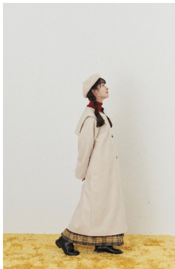
ビッグセーラーカラーコート price: 6,900 yen (+tax) color:natural/black/orange size: free

トラッドなコーディネートが完成するタータンチェック柄のロングスカート。少し起毛させた生地を使用し、シーズンムードたっぷり。サスペンダーやサッチェルバッグを合わせてクラシックにもパーカーやスウェット合わせてカジュアルにもと万能な1枚。