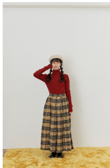
タータンチェックタックスカート price: 3,900 yen (+tax) color: yellow/pink size: free

インパクトのあるセーラー襟が目を引き、カットソーワンピース。ブラウス襟とボディのカジュアル素材のコンビが珍しいデザイン。長すぎない着丈でタイツや柄ソックスでmerlotらしいコーディネートを楽しんでいただけます。