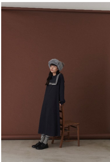
スクエアラインBIGセーラーカラーワンピース price:3,600 yen (+tax) color: navy/light gray/Bordeaux size: free

インパクトのあるセーラー襟が目を引き、カットソーワンピース。ブラウス襟とボディのカジュアル素材のコンビが珍しいデザイン。長すぎない着丈でタイツや柄ソックスでmerlotらしいコーディネートを楽しんでいただけます。