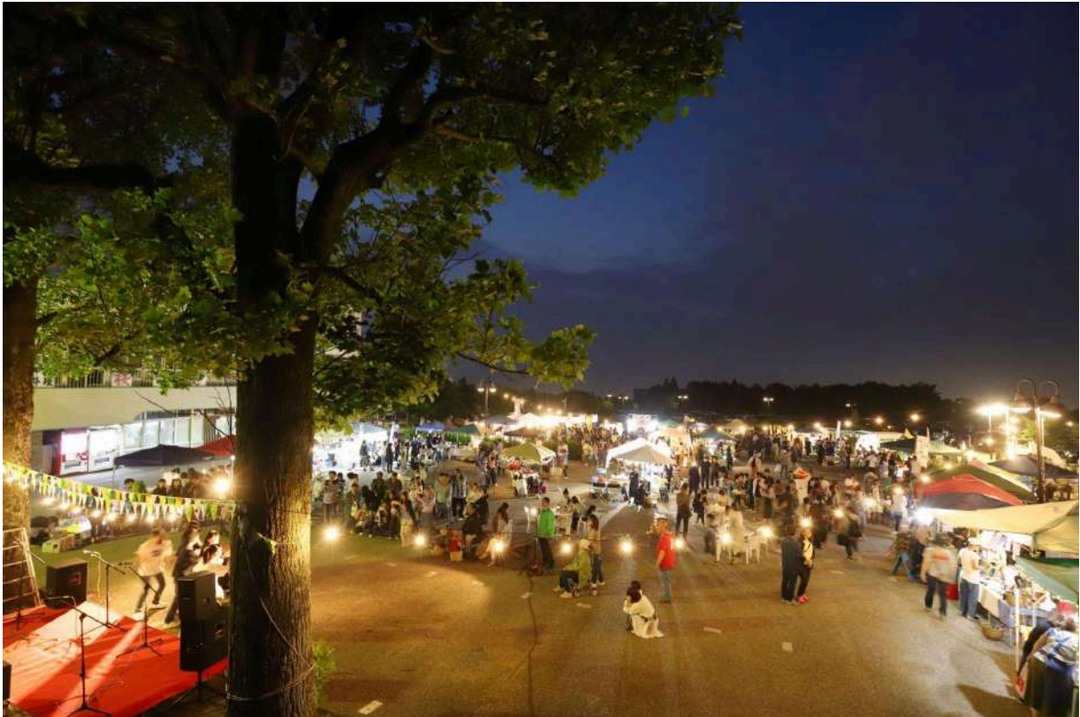
静岡市観光国際課 提供

「日本平夜市」は、日本夜景遺産に認定された絶景を背景に、毎月第4土曜日に開催される夜型マルシェです。最大70店舗以上の出店があり、1日で約1万人の来場者を誇ります。標高の高さから来る夏の夜の涼しさが快適性を担保しており、音楽ライブや多数の飲食店が織りなす空間は老若男女問わず楽しめます。周辺の夢テラスや東展望台といった視点場との回遊性も緻密に設計されており、自然景観と食の融合が見事です。