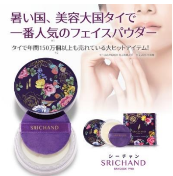
SRICHAND 「トランスルーセントパウダー」 <4.5g・900 円 (税抜)、10g・1,800 円 (税抜) >

高温多湿なタイでのベースメイクの定番といえば、1948 年創業の老舗化粧品ブランド SRICHAND の「トランスルーセントパウダー」。美容大国タイで 5 年累計 550 万個以上売れるベストセラーコスメで、「マスクをつけても、汗をかいてもメイクが落ちにくい・崩れにくい・テカリにくい」と話題の商品です。お肌に優しい天然成分を配合し、シルクのようになめらかで、きめ細かなパウダーが皮脂を吸着、透明感のあるお肌に導きます。携帯に便利な 4.5g とお得な 10g の 2 種を取り揃えます。