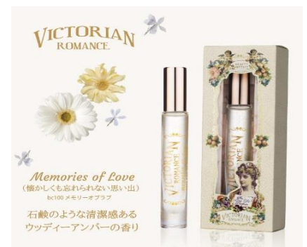
ビクトリアンロマンス ミニ オードパルファン メモリーオブラブ <1,980 円 (税抜) >

レトロで可愛いパッケージが特徴の Beauty Cottage は、自然由来成分で作られたタイ発ナチュラルコスメブランドです。関西エリアでは実店舗として初めて Laox 京都河原町 OPA 店に登場しました。ヨーロッパヴィンテージ調の香水 VICTORIAN ROMANCE (ビクトリアンロマンス) シリーズを展開し、その中でも日本人から特に人気が高いメモリーオブラブは SNS で「褒められ香水」、「モチ香水」として人気です。持ち運びに便利なロールオンタイプで、外出先でも気軽に香りを楽しんでいただけます。