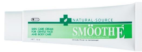
SMOOTH E(スムーズ E)スキンケアクリーム <15g・900円(税抜)、40g・1800円(税抜)>

SMOOTH E のスキンケアクリームはニキビの跡やキズ跡をケアしてくれる保湿クリームです。タイの薬局で高い人気を誇る国民的美容クリームで、植物天然成分のアロエベラやホホバオイル、ツボクサエキスなどが、独自技術により肌の深部まで浸透してしっかりと保湿するので、乾燥しやすい秋冬シーズンにおすすめの一品です。