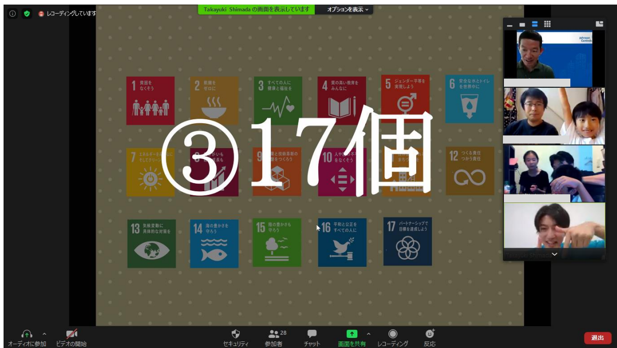
【SDGs クイズに元気に参加する従業員家族とファシリテーターを務める学生】

まずは、ウォーミングアップとして SDGs についてのクイズを実施。事前に公開されていた教材や動画で予習していた子どもたちは、オンラインのチャット機能を活用しながら、元気に回答しました。