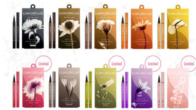
①スキルレスライナー 01~10 (全10色) 価格：各色¥1,650 (税込)

機能性と美しさを追求。より自分らしく、より自分らしい、理想のアイメイクを叶えるアイライナー。