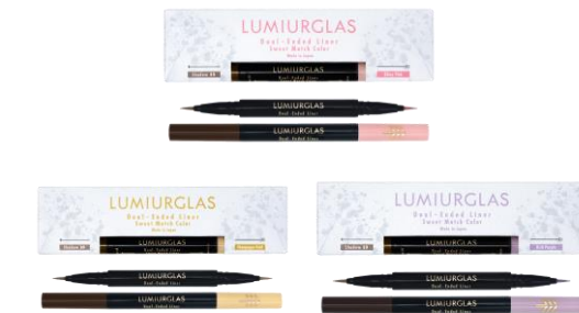
②デュアルエンドライナー 01~03 (全3色) 価格：各色¥1,980 (税込)

機能性と美しさを追求。より自分らしく、より自分らしい、理想のアイメイクを叶えるアイライナー。