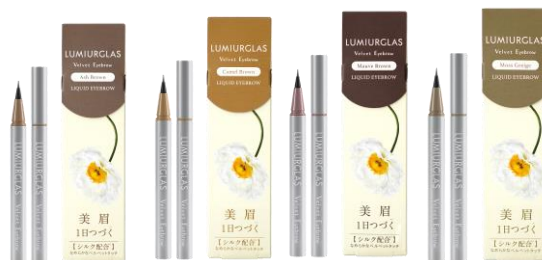
④ベルベットアイブロウ 01~04 (全4色) 価格：各色¥1,760 (税込)

眉専用の超極細ベビーブラシを採用。透け感カラーでニュアンスチェンジが楽しめる、ティントタイプのリキッドアイブロウ。