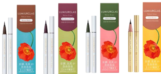
③ベルベットライナー 01~04 (全4色) 価格：各色¥1,650 (税込)

洗練ラメと、影ライナーが、一本に。何役もこなす万能ライナー。ひと塗りで、いつもの目元にさりげない輝きを。