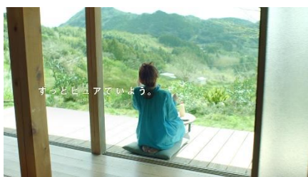
(石田さん) 新鮮オン新鮮