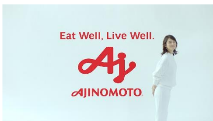
(石田さん) Eat well, Live well