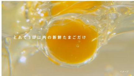
(NA) とれたて3日以内のたまごから