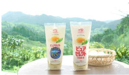
(NA) ピュアセレクトマヨネーズ