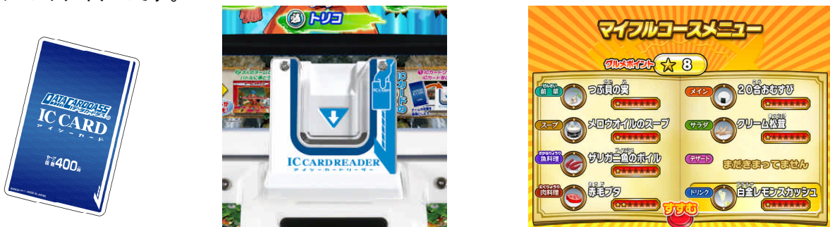
(左写真)データカードダス オフィシャルICカード (中央)ICカードリーダー (右写真)ゲーム画面

筐体には今回新たに、「ICカードリーダー」をデータカードダス筐体中央部分に設置しています。この「ICカードリーダー」に別売りの「データカードダス オフィシャルICカード」を差し込むと、バトル終了時にもらえる「グルメ食材」を記録し、オリジナルの「マイフルコースメニュー」を作成することができます。マイフルコースメニューを作成すると、メニューの内容に応じてプレイ開始時にリーダーのパラメーターがアップします。最強の美食屋を目指すためのマストアイテムです。