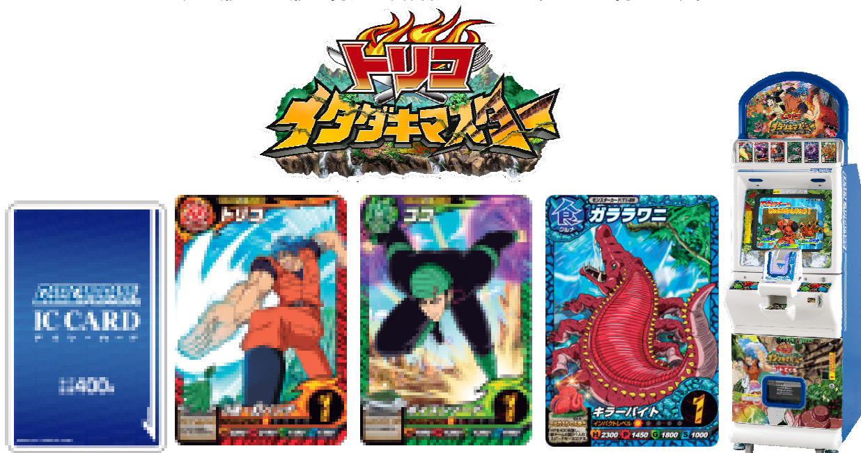
(画像) 上:商品ロゴ 左下:データカードダス オフィシャル IC カード 中央:カード一例 右:筐体 ©島袋光年/集英社・フジテレビ・東映アニメーション ©BANDAI 2011