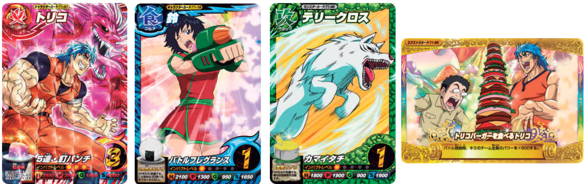
(画像)カード例 ©島袋光年／集英社・フジテレビ・東映アニメーション

第1弾のカードは、トリコの世界を堪能できる「トリコ」や「ガララワニ」など多彩なキャラクターやモンスターを新規で描き起こした全50種。それぞれのカードにはバトル中に食べることができるグルメ食材が記載されています。