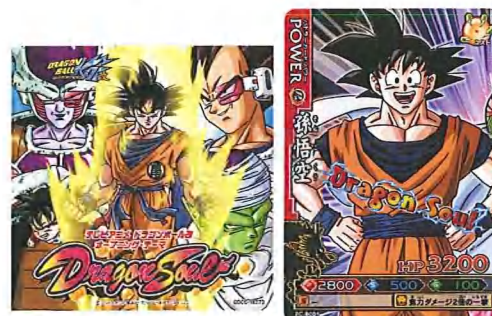
(左)アニメ主題歌「Dragon Soul」(1,365円/税込) (右)同梱のプロモーションカード 「PC-B001 孫悟空」