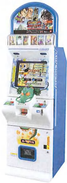
【データカードダス筐体】