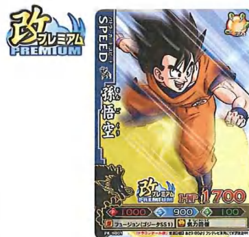
▲改プレミアムコレクションで配布の「PK-B001 孫悟空」

キャンペーン実施店舗にてプロモーションカード「PK-B001 孫悟空」を先着順で配布