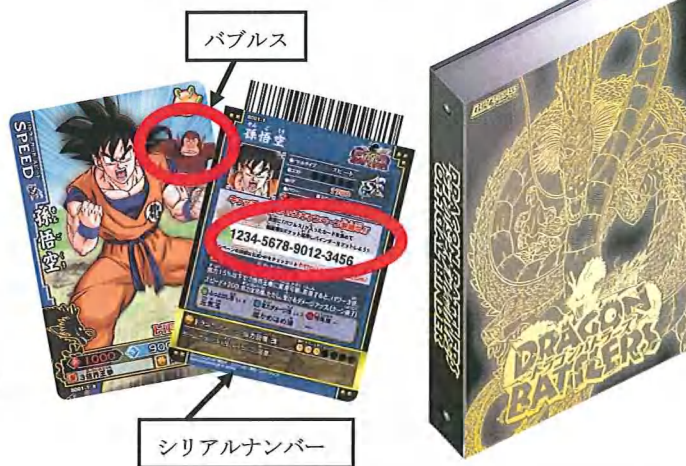
(左)バブルス入りシリアルナンバーつきカード 表面 (中)バブルス入りシリアルナンバーつきカード 裏面 (右)特製9ポケット箔押しバインダー