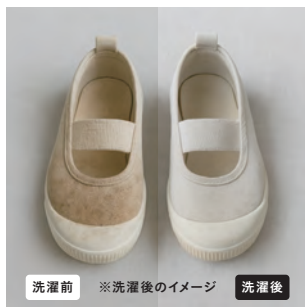
洗濯前 ※洗濯後のイメージ 洗濯後