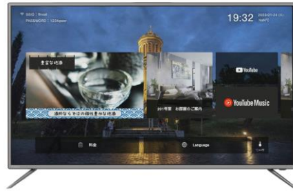
<pipico 導入イメージ画像>