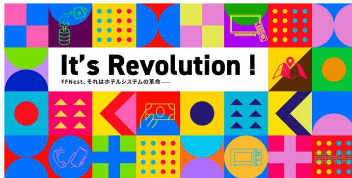
FFN 社キービジュアル