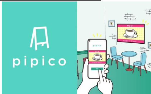
<スマホで今すぐ！サイネージ pipico>