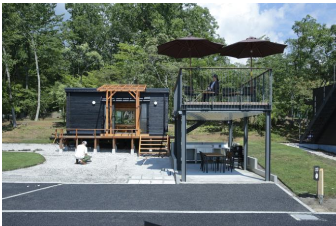
(展望デッキとトレーラーコテージ外観)

遊び心をくすぐるロフトスペース付・冷暖房完備のトレーラーコテージです。展望デッキからは、サーキットを一望でき、デッキ下は車を停めることもできるので、雨や夜露で車を濡らしたくない方に最適。キャンプギアをお持ちでない方でも、気軽にご宿泊いただけます。