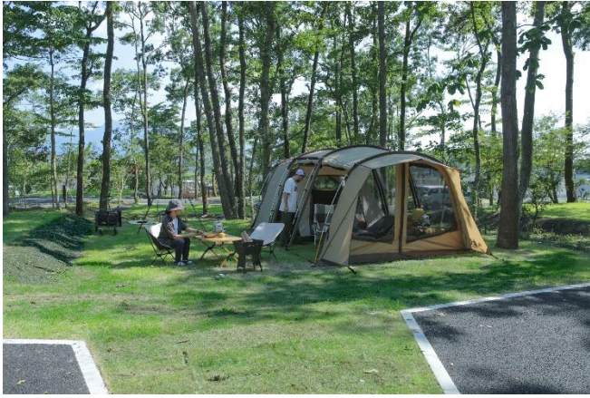
(オートキャンプサイト設営イメージ)