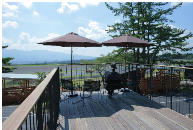
(展望デッキとサーキット向きの眺望)