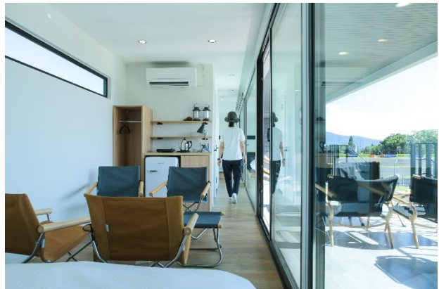
(ヴィラ内リビングとテラス)