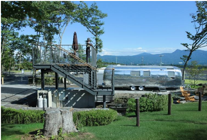
(エアストリームとサイト内展望デッキ)

世界中で愛されるエアストリームのヴィンテージ車両（1970年製）をフルリノベーションし、古き良き佇まいを残しつつ、充実した設備で快適な滞在をご提供します。展望デッキからサーキットを望む絶好のロケーションと天気の良い日は富士山ビューも楽しめます。