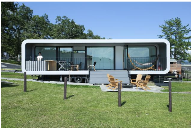
(トレーラーヴィラ外観)

まるでホテルのような設えのトレーラーヴィラ。冷暖房、トイレ、シャワー、冷蔵庫、Wベッド完備の充実設備に加え、デッキスペースにはハンモック、BBQガスグリル、キッチンを備えております。焚き火台も設置されておりますので、サーキットを眺めながら気軽に上質なアウトドア体験を味わえます。