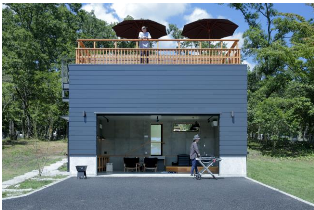
(キャンピングガレージハウス外観)

車好きのガレージを疑似体験できるコンセプトサイト。ガレージ内には就寝スペースがあり、冷暖房、BBQ ガスグリル、キッチン、冷蔵庫も完備。外には焚き火ができる駐車スペースがあります。