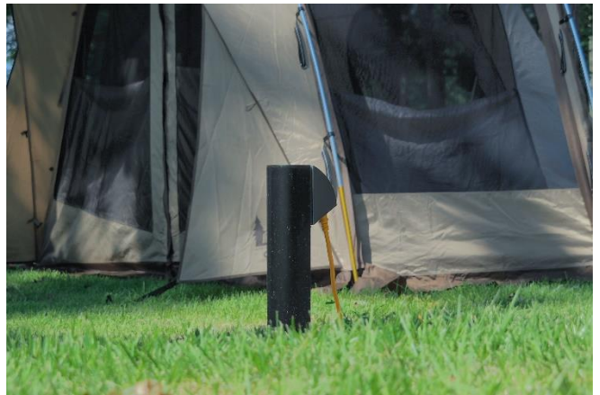
(サイト内 常設電源ポート)