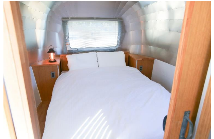
(エアストリーム内寝室)