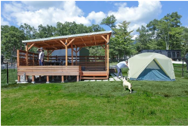
(サイト設営イメージ)