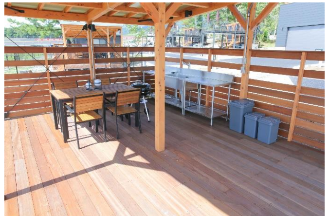
(ルーフデッキのダイニング)