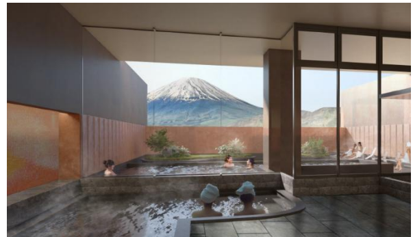
温泉施設イメージ

富士の眺めと一体化する温泉施設では、目の前に広がる富士山を背景に、天然温泉とサウナがお客様の心と体を癒します。