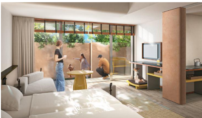
愛犬と泊まれる客室イメージ

また施設内には、富士山の麓から連なる緑豊かな森と開放的な広場空間、この地で育まれた地下水が流れるせせらぎを整備し、居心地の良い環境を創出。春には桜並木が行き交う人たちの目を楽しませます。