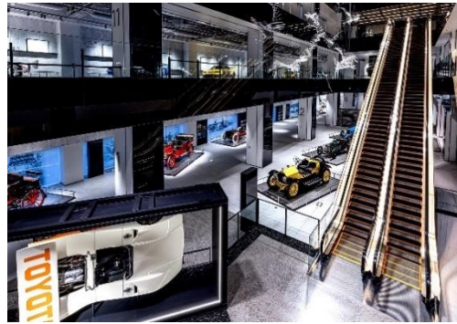
富士モータースポーツミュージアム (2022 年開業)