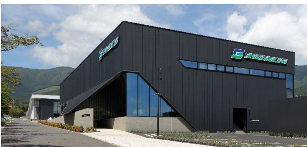
シェイドレーシング FUJI ファクトリー (2023 年開業)