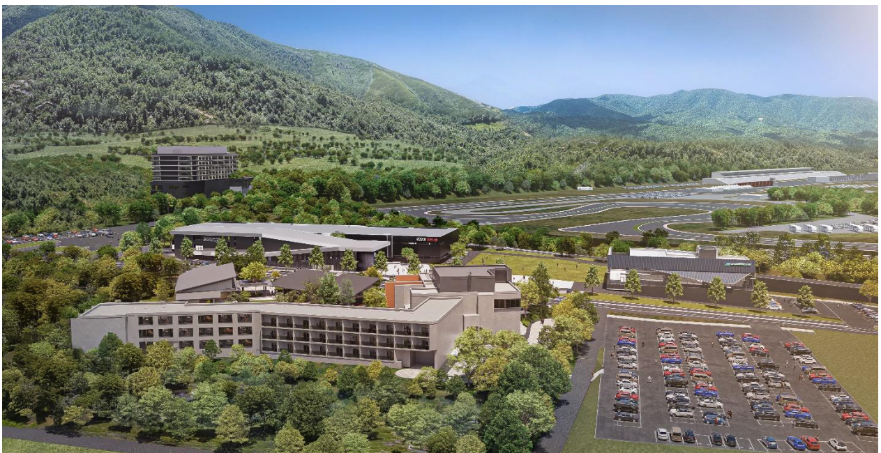
富士モータースポーツフォレスト全体イメージ

2022 年にはラグジュアリーな体験を提供する「富士スピードウェイホテル」と、時代を象徴するレーシングカーを展示する「富士モータースポーツミュージアム」がオープンしました。さらに、2023 年には「ルーキーレーシングガレージ」「ウェルカムセンター」「シェイドレーシング FUJI ファクトリー」、2024 年には「RECAMP 富士スピードウェイ」が開業し、エリア全体が「モビリティ体験の聖地」を目指して着実に発展を続けています。