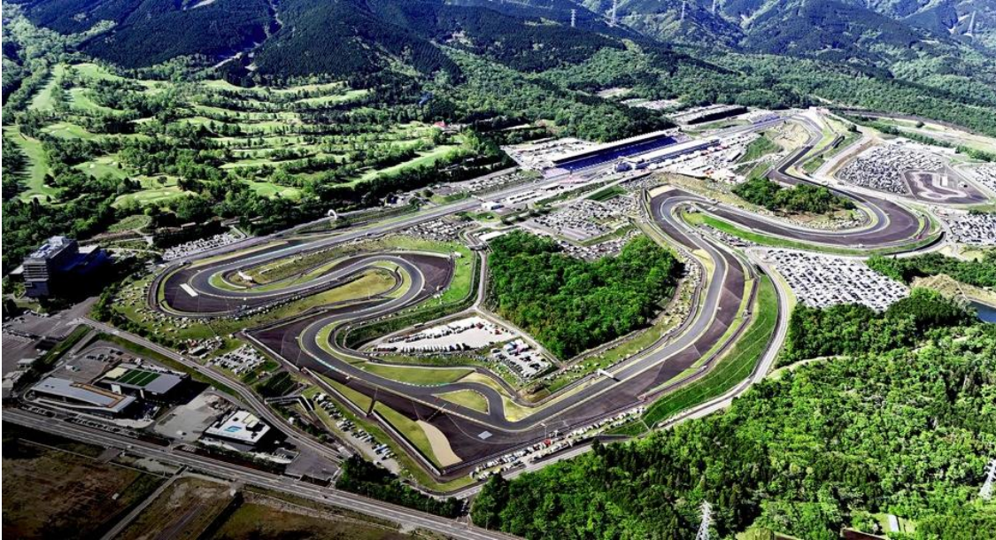
富士スピードウェイ (1966 年開業)