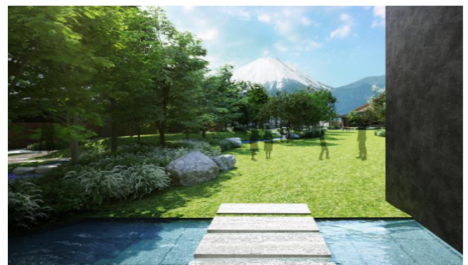
ランドスケープイメージ