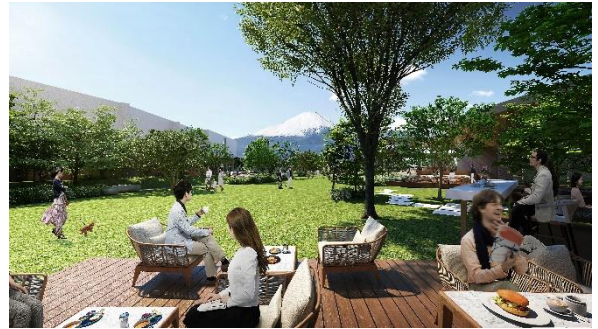
レストランのイメージ

和・洋・中の多彩な料理を提供するレストランなど、バラエティに富んだ 8 店舗が出店を予定しています。地元静岡の新鮮な食材を活かした料理をお楽しみいただけます。