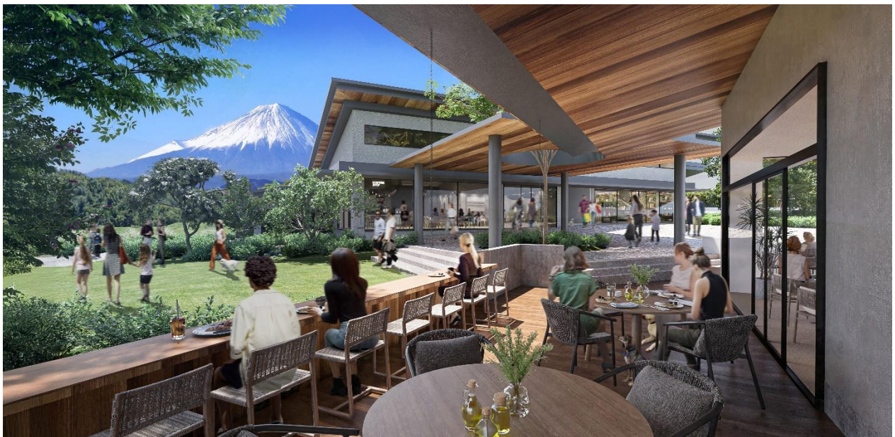
「(仮称) おおみかテラス」イメージ

「(仮称) おおみかテラス」は 2026 年春に一部のレストランが先行オープン、2027 年春に温泉施設・ホテル等も含め全面開業の予定です。