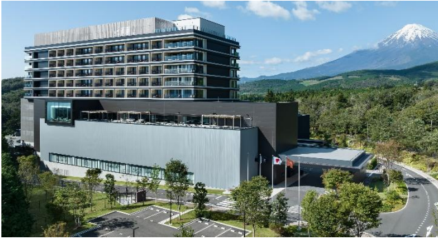
富士スピードウェイホテル (2022 年開業)