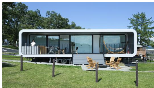
RECAMP 富士スピードウェイ (2024 年開業)