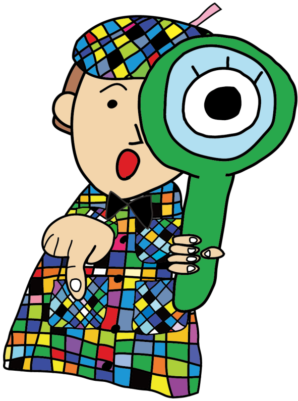
ナツケンキャラクター ナツケンくん