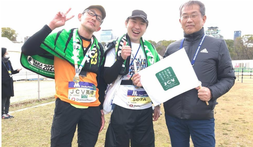
大阪マラソンを走り終えた JCV のチャリティランナー

大阪マラソンのチャリティ活動への理解を深め、支援の輪を広げていくことを目的に出場していただくのがチャリティランナーです。チャリティランナーは、ファンドレイジングサイト(寄附先団体への寄附を募る Web 上のサイト)で、支援する寄附先団体を選択し、エントリー時にご自身で 1,000 円の寄附をしていただくとともに、家族や友人等に対しサポーターとしての協力を広く呼びかけ、合計 7 万円 (※参加料別途) 以上の寄附を集めていただきます。(寄附が合計 7 万円以上になるとチャリティランナーとして出走できます)