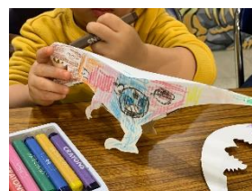
きょうりゅうペーパークラフト

◎開催日:2021年7月10日(土)～9月5日(日)の土日祝日、8月10日(火)～16日(月)