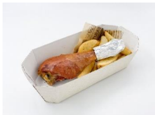
山本のハンバーグ MeatBall and Wine 「恐竜レッグセット」