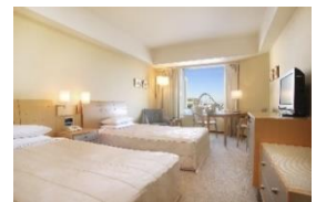
スタンダードツインルーム(イメージ)

詳細は、東京ドームホテル 公式ウェブサイトをご確認ください。 ( https://www.tokyodome-hotels.co.jp/stay/plan/dinosaur/ )