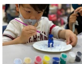
ペイント・ザ・ダイナソー