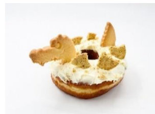
DUMBO Doughnuts and Coffee 「ダイナソーダーナツ」