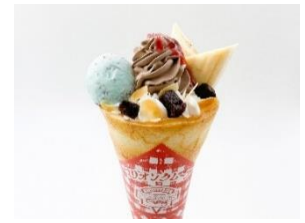
マリオンクレープ (Hi!EVERYVALLEY 店) 「恐竜の世界！ダイナソークレープ」