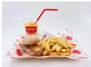
SCHMATZ 「お子様恐竜ドッグセット」

この度、展覧会期間中は、東京ドームシティ内の「Hi!EVERYVALLEY(ハイ！エブリバレー)」が『ジュラシックバレー』として展開することが決定。エリア内では展覧会にちなんだコラボメニューの提供や、ファミリー向けの人気ワークショップの実施、恐竜の世界観を感じられる装飾などをお楽しみいただけます。さらに、東京ドームで開催するジャイアンツ戦の観戦がセットになった親子向けのスペシャルチケットを数量限定で販売するなど、夏休みの思い出作りにぴったりの企画をお知らせします。