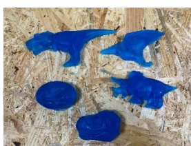
きょうりゅうせっけん作り