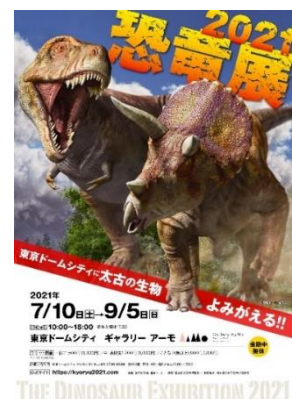
THE DINOSAUR EXHIBITION 2021