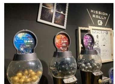
ミッションラリーQ