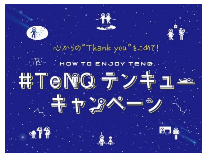
『#TeNQ テンキュー キャンペーン』 キービジュアル