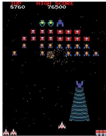
「ギャラガ」※画像はイメージ GALAGA™& ©Bandai Namco Entertainment Inc.