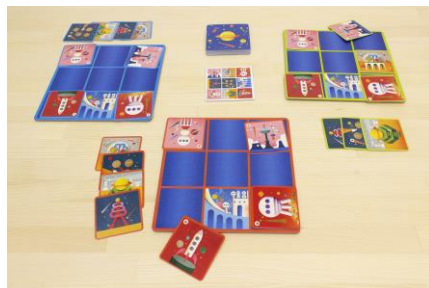
「スペースビルダー」