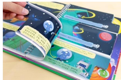
「フォボスのほしめぐり」