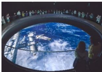
宇宙ミュージアムTeNQ(テンキュー) ※画像は「シアター宙(ソラ)」

なお、TeNQ閉館後の黄色いビル6Fフロアの活用につきましては、決まり次第発表させていただきます。