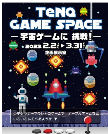
『TeNQ GAME SPACE -宇宙ゲームに挑戦!-』 キービジュアル