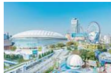
東京ドームシティ

都内有数の大規模レジャー施設として魅力ある施設開発やイベント企画運営に注力するほか、流通事業「shop in」の展開や熱海でのリゾート事業、公共施設および民間スポーツ施設の運営受託等の外部展開を進めています。