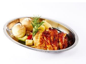
リブローズステーキ(150g)、てりやきアボカドバーガー、スモアココア、柚子メープルのルイボスティー、グリルチキンプレート ※画像上段左から