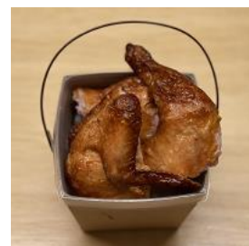
吊るしローストチキン半身 BOX