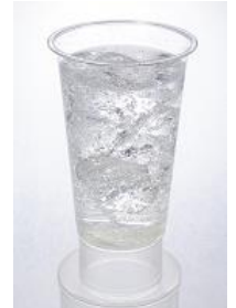
チャージレモンサワー

◎商 品:チャージレモンサワー 750 円 ※香り高い NOW8 自慢のレモンサワー ニトロレモンサワー 800 円 ※トウガラシシロップを加えた、大人な辛レモンサワー