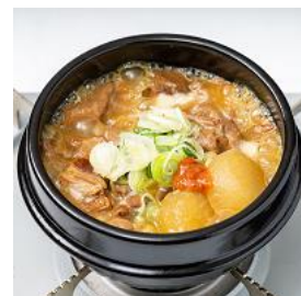
1日600杯売れるもつ煮込み