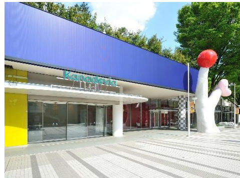
施設外観(イメージ)