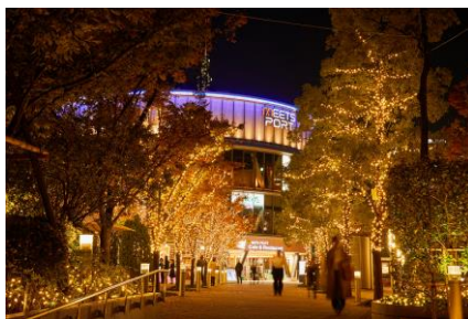
シャンパンゴールドイルミネーション