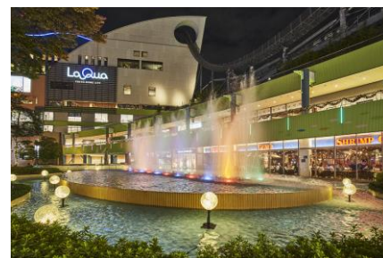
ルミナスドロップ