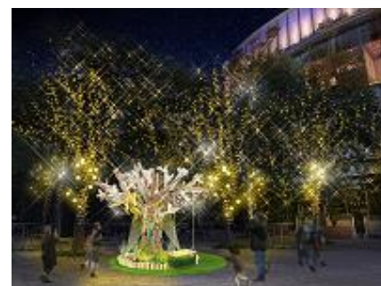
フォトフレームオブジェ

フォトフレームオブジェ自体にも様々な見所が隠れているので、しゃがんだり、横から見たりすると、あなただけのシャッターチャンスが見つかるかもしれません。きれいに写真が撮れる、思わず写真が撮りたくなるオブジェで自分だけのベストアングルを探してみてください。