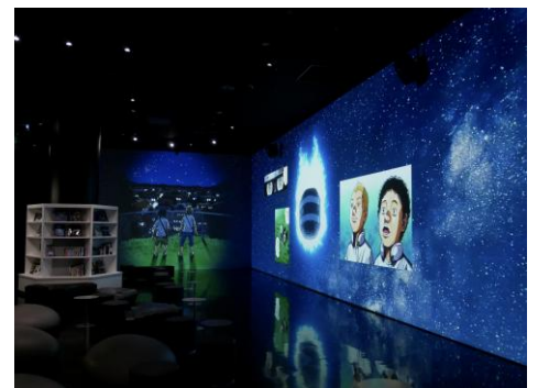
画像はイメージ ©小山宙哉／講談社