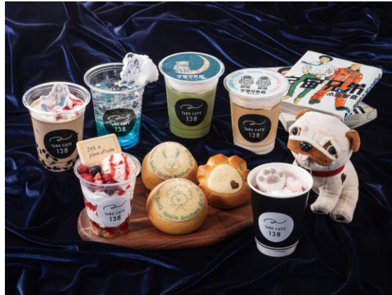
画像はイメージ ©小山宙哉／講談社