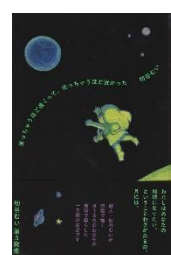
『笑っちゃうほど遠くって、光っちゃうほど近かった』(ナナロク社)