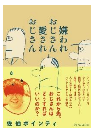
『嫌われおじさん 愛されおじさん』 (垂紀書房)