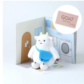
コラボフード&ゴートくんグッズ(左)、ゴートくん アニバーサリーセット(右) ※画像はイメージ