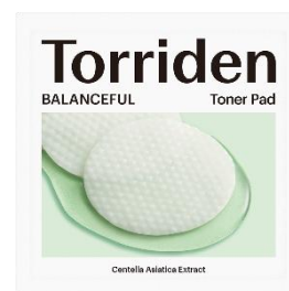
バランスフル シカ トナーパッド サシェ

また、ショップインでTorriden商品を2,000円以上購入する際、スパ ラクーアの利用レシートを提示すると、先着200名様に「バランスフル シカ クリーム(20ml)」と「Torridenオリジナルチャーム」(全4種よりランダム配布)がプレゼントされます。