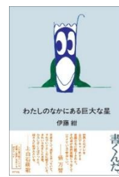
『わたしのなかにある巨大な星』 (ポプラ社)