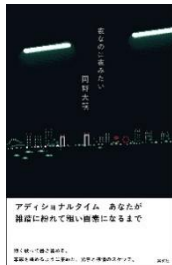
『夜なのに夜みたい』(集英社)