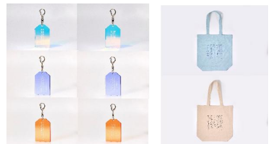
アクリルキーホルダー、トートバッグ ※画像はイメージ