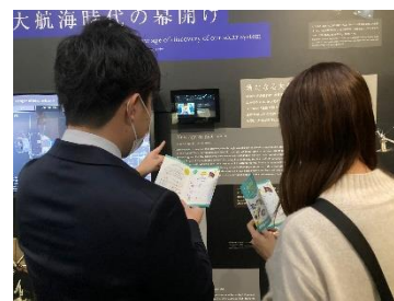
過去のリアル宝探しイベントの様子