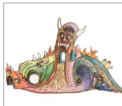
片桐仁的公園(仮) イメージ

詳細・応募先ウェブサイト: https://katagirijin20th.myshopify.com/