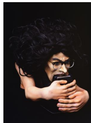
記念すべき第1作目「俺」ンテープ」