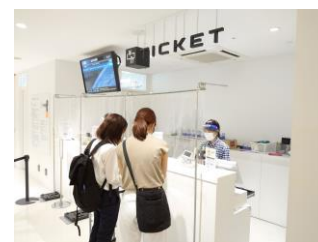
チケットカウンターの様子