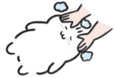
Recharge シールラリー シールイメージ