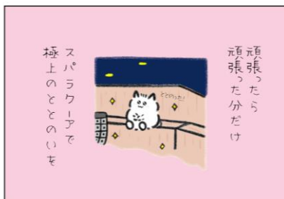
「褒めラニアン」スパ ラクーアオリジナルイラスト イメージ