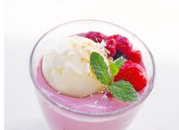
プーチ褒めスイーツ イメージ