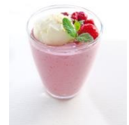
「バナナとベリーのスィーツ ココナッツアイス添え」イメージ