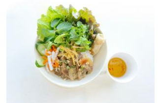
「ブン・ディット・ヌン」イメージ