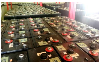
【ユーザーに合わせて電池を組成】