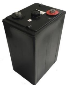
【再生鉛蓄電池単セル】