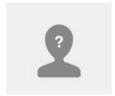
You What do you want to do?