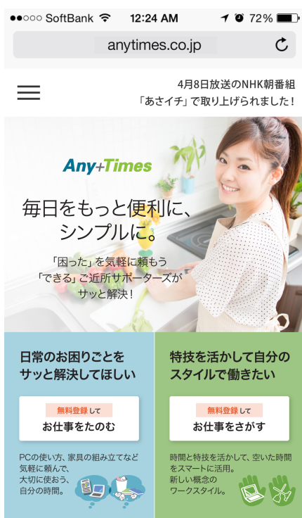
◀ スマホ向けサイトトップ ▶

エニタイムズは個人のスキルとニーズをマッチングさせる「ご近所サポーターズネットワーク」を提供してきましたが、今回の保険導入により、これまで以上に気兼ねなくサイトを利用できるようになることができます。この取り組みを通して、近隣の人同士が気軽に利用できるプラットフォームを提供することで、地域ネットワークの活性化を目指します。