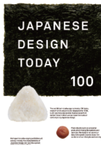
Japanese Design Today 100 メインビジュアル

ジャクエツは、子どもたちの成長に欠かせない“あそび”を引き出す遊具「OMOCHI MINI」を出展いたします。OMOCHI MINIは大人目から見ると、どのような遊びを子どもたちから引き出そうとしているのか分かりません。ですが、子どもたちは、独特のフォルムを元に様々なあそびを自ら作り出して行きます。一人一人が思い思いにこの遊具を使うことにより、新しい遊びがどんどん創発されていきます。全身を使っておもわずあそんでしまうこのデザインをぜひ、ご覧いただきたいです。