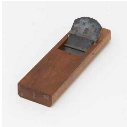
今年103歳になる祖父から受け継ぐ鉋(かな) 牧神祭具店