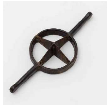
鋳物製の竹割。丸い竹を等分に割るための道具 長岡銘竹株式会社