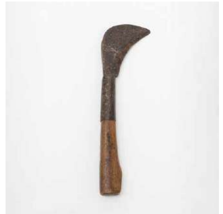
「枝打ち鋸」は、竹の枝を落とすために使う 長岡銘竹株式会社