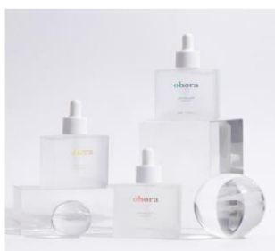
Pro Easy Peel Remover ¥1330