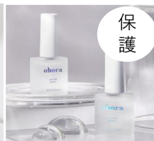
Pro Nail primer ¥1660