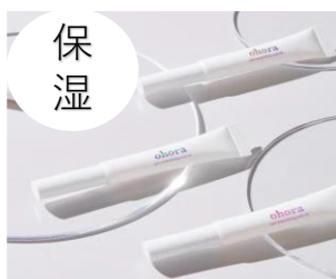
Pro nourishing nail oil ¥1880