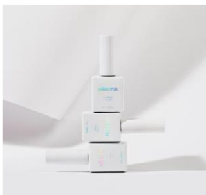
Pro Glossy Top Gel ¥2180