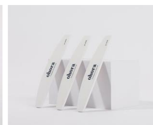
Pro Soft File ¥430