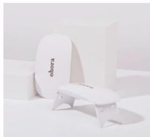
Gel Lamp ¥1880