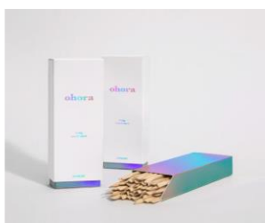
Long Wood Stick ¥640