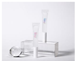
Pro Loose Skin Remover ¥1080