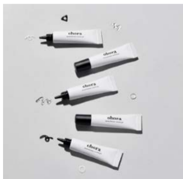
monochrome custom gel set