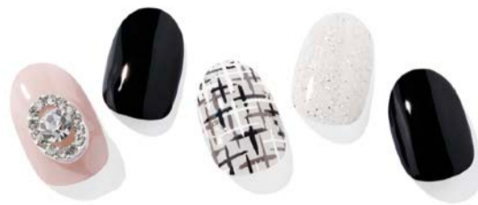
N Swanky ¥1,880

神秘的な月夜をモチーフにしたムーンライトネイル。月と星が輝く静かな夜の世界をネイルで表現。透明感のあるネイビーは澄んだ夜空を、グレーが混じり合うマーブルデザインは星雲をイメージさせます。月や星の色に合わせて、華奢なゴールドのリングやブレスレットをコーディネートしても素敵。落ち着いた雰囲気にも華やかさが同居するデザインです。