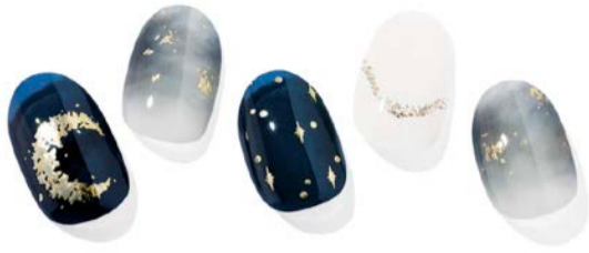
N Moonlight ¥1,660

神秘的な月夜をモチーフにしたムーンライトネイル。月と星が輝く静かな夜の世界をネイルで表現。透明感のあるネイビーは澄んだ夜空を、グレーが混じり合うマーブルデザインは星雲をイメージさせます。月や星の色に合わせて、華奢なゴールドのリングやブレスレットをコーディネートしても素敵。落ち着いた雰囲気にも華やかさが同居するデザインです。