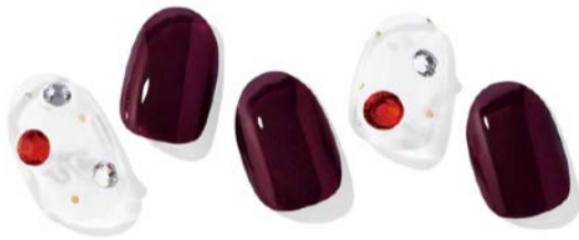
N Dash ¥1,880

ネイビーグリッター逆グラデーションネイル。細かなブルーのグリッターと大きなグリッターを加え、輝きの質を高めました。澄んだネイビーカラーが指先を明るく演出してくれます。