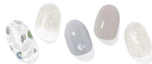
N Sea Foam

幻想的な星空や、雪などをイメージにミラーデザインやグリッターをあしらった冬にぴったりのデザイン