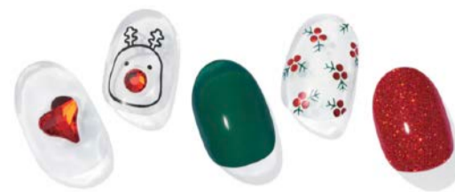
N About Rudolph

ハッピーな冬時間を約束するスノーマンチェックネイル。赤のチェックネイルとキュートな雪だるまのペイントが目を引きネイルデザイン。メリハリの効いたカラーリングが冬の風景に映え、楽しくハッピーな時間をつくり出します。デニム×ニットといったカジュアルなスタイルのほか、トラッド系ファッションとの相性もばっちり。デイリーで活躍します。