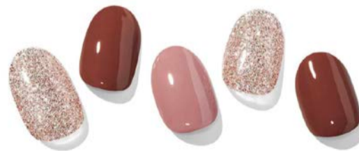
H Heimish ¥1,660

カラーコンビネーションネイル。オーセンティックなバーガンディー&ベージュにガラス玉のように輝くグリッターを組み合わせ、洗練されたネイルに仕上げました。