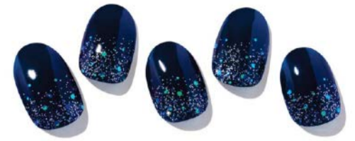
N Polaris ¥1,660

華やかで高級感のあるツイードプレミアムネイル。大きめのパーツを施したポイントネイルに、ツイードパターン、グリッター、そしてツヤのあるブラックのフルカラーネイルがセット。華やかで洗練された印象をつくり、なにげないしぐさも優雅に見えます。パールのアクセサリを合わせてもステキです。