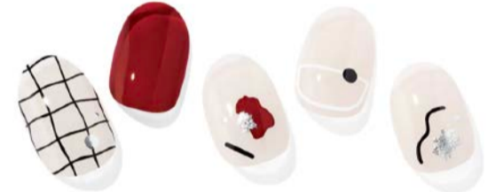
N Incense ¥1,660

愛らしさ弾けるローズスパークリングネイル。誰からも愛されるピンクとバーガンディーの組み合わせに、スパークリングワインの泡のようなドットネイル、オレンジゴールドのラインがキラリと光るポイントネイルをプラス。愛らしさと華やかさが、指先から弾けるようにあふれます。デートネイルにもぴったり。思わず手をつなぎたくなるデザインです。