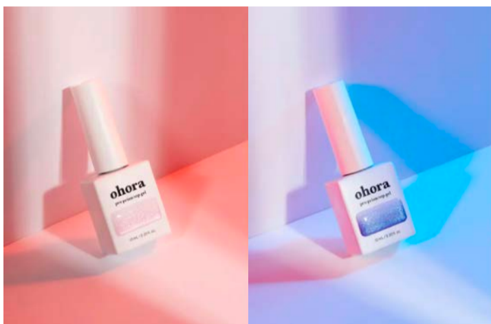
pro prism top gel (プロプリズムトップジェル)