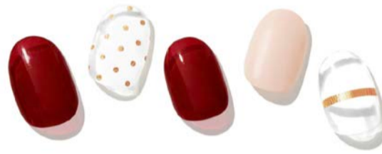
N Rose Sparkling ¥1,660

魅惑のバーガンディーネイル。深みのある赤みのバーガンディーは、手を美しく見せ高級感を感じさせる色です。1本だけクリアネイルに小さなラインストーンのパーツを合わせることで抜け感をつくり、大人の可愛らしさを表現。