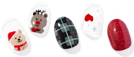
N Gomdolph & Santagom

ohoraらしいトナカイや雪だるまなどが特徴的な遊び心たくさんのモチーフデザイン