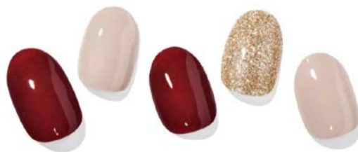
N Rosewood ¥1,660

抽象画のようなモダンアートネイル。赤、白、黒の3色を基調に銀色の箔でアクセント。シンプルながらユニークで、抽象画のようにひとつひとつのネイルに物語を感じます。モノトーンのスーツファッションや革のジャケットなどに合わせてもおしゃれ。