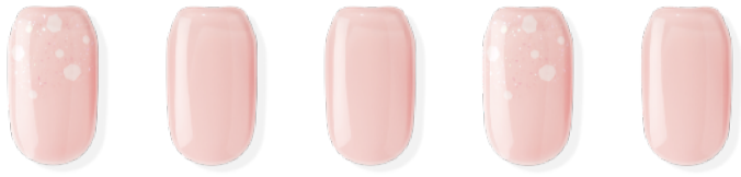
N Morning Dew ※近日発売予定 ¥3,500