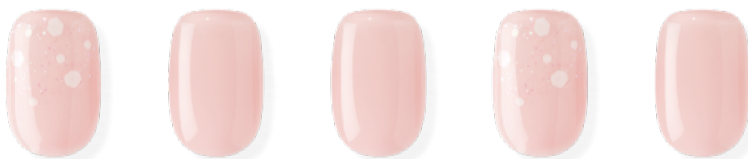
N Morning Dew ※近日発売予定 ¥3,500