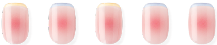
N Cheek ※近日発売予定 ¥3,500