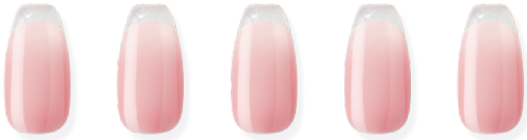
N Peaches ※近日発売予定 ¥3,500