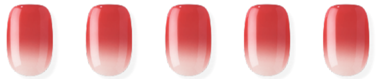
N Rose Water ※近日発売予定 ¥3,500