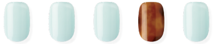
N Jade ※近日発売予定 ¥3,500