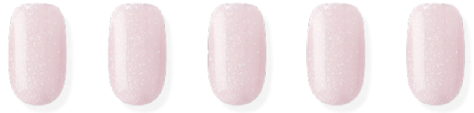
N Pixie ※近日発売予定 ¥3,500