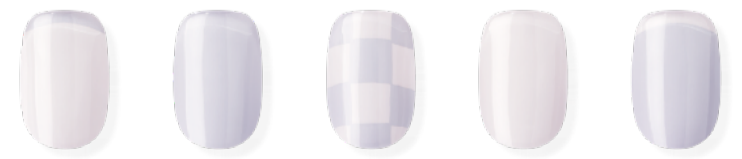
N Mauve Checker ※近日発売予定 ¥3,500