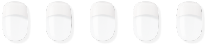
N Essential ※近日発売予定 ¥3,500