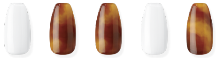
N Woody ※近日発売予定 ¥3,500